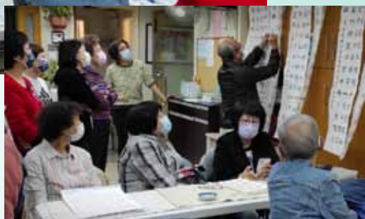
老師在講評學員作業