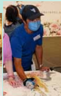
文錦禧原子彩筆掃描