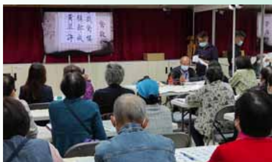
電子屏幕清晰展現老師的教學示範

書法班有不同程度的日、夜兩個班。導師認真的教學態度和教學設備的現代化，備受學員的歡迎。