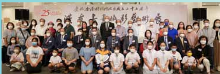
主禮嘉賓與參展者合影