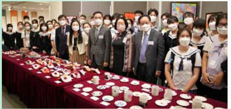
楊潤雄局長參觀母校學生作品後與參展學生合影

展期三天，雖然碰不上假日，但仍有接近1500觀眾到場參觀，實屬難得。期望不久的將來，我們的藝術成果再次呈現。