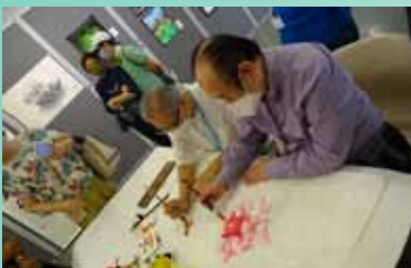
秦思新 張永昌合作牡丹圖